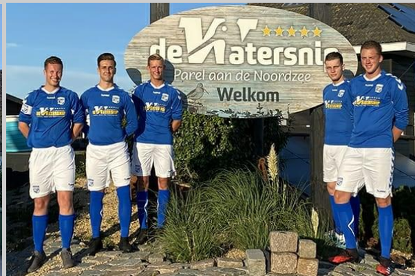
Petten 1 sponsorfoto's seizoen 2020/2021 - Begin van elk seizoen worden bij elk team teamfoto's (met logo van sponsor) gemaakt die op de website en social media komen te staan.